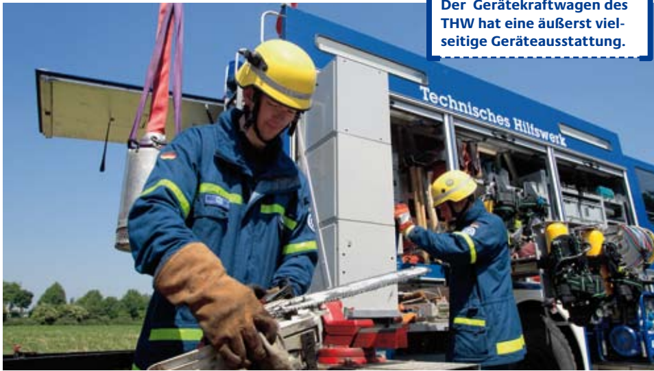
Der Gerätekraftwagen des THW hat eine äußerst vielseitige Geräteausstattung.