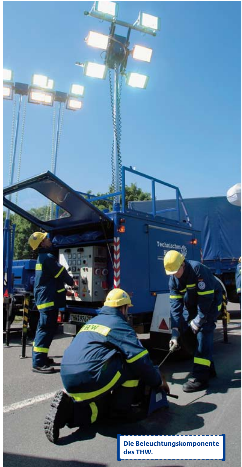
Die Beleuchtungskomponente des THW.