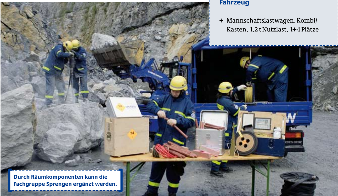
Durch Räumkomponenten kann die Fachgruppe Sprengen ergänzt werden.