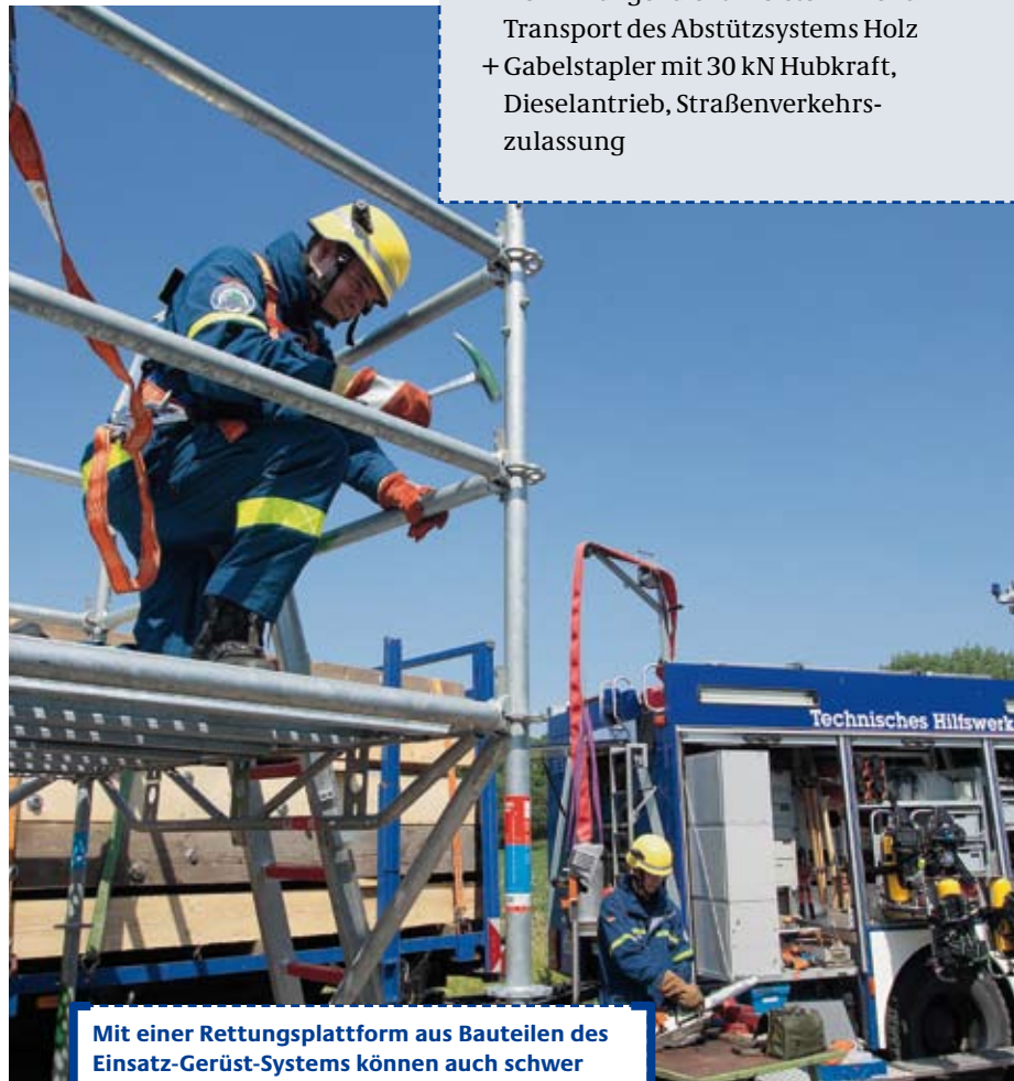
Mit einer Rettungsplattform aus Bauteilen des Einsatz-Gerüst-Systems können auch schwer zugängliche Einsatzstellen erreicht werden.

Durch eine universelle Abstütz- und Sicherungs-Komponente aus Holzbauteilen – Abstützensystem Holz (ASH) – kann die Ausstattung der Bergungsgruppe 1 ergänzt werden. Mit dem Einsatz-Gerüst-System (EGS) steht den Bergungsgruppen ein vielseitiges Hilfsmittel für Rettungs-, Bergungs- und Sicherungsarbeiten zur Verfügung. ■