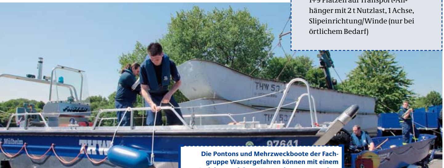
Die Pontons und Mehrzweckboote der Fachgruppe Wassergefahren können mit einem Ladekran auf dem Wasser abgesetzt werden.